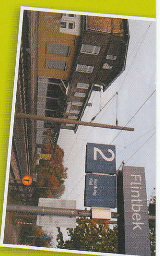
Nur ca. 5 Minuten zu Fuß zum Bahnhof.