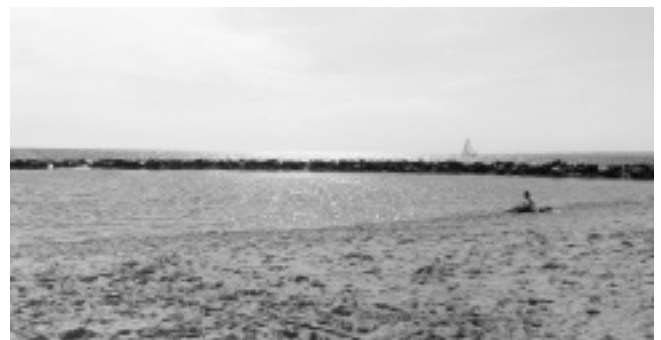
Von so einem Beach-Feld träumt man in Flintbek (zur Not auch ohne Wasser). Für die Weihnachtsfeier wurde die Beachvolleyball-Halle in Bordesholm gebucht.