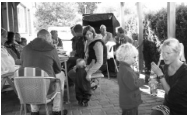
Regnerisches Sommerfest 2009