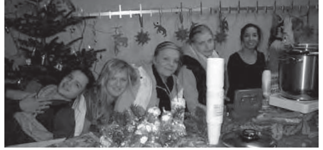
Schule am Eiderwald - Adventsbasar