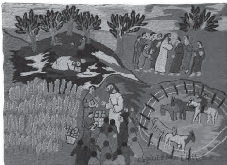
Wie viele Brote habt ihr?, Las Bordadoras de Copiulemu

Wir laden Sie alle ein, mit uns darüber nachzuden-