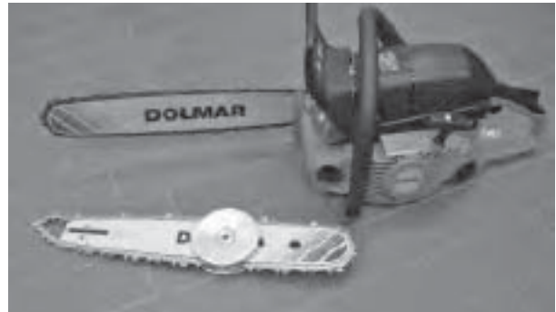
Bild montierte Schwert mit einer normalen Kette ist für das Trennen von Holz.

Das andere Schwert mit der RescueCut Sägekette kann folgendes Material zerschneiden: