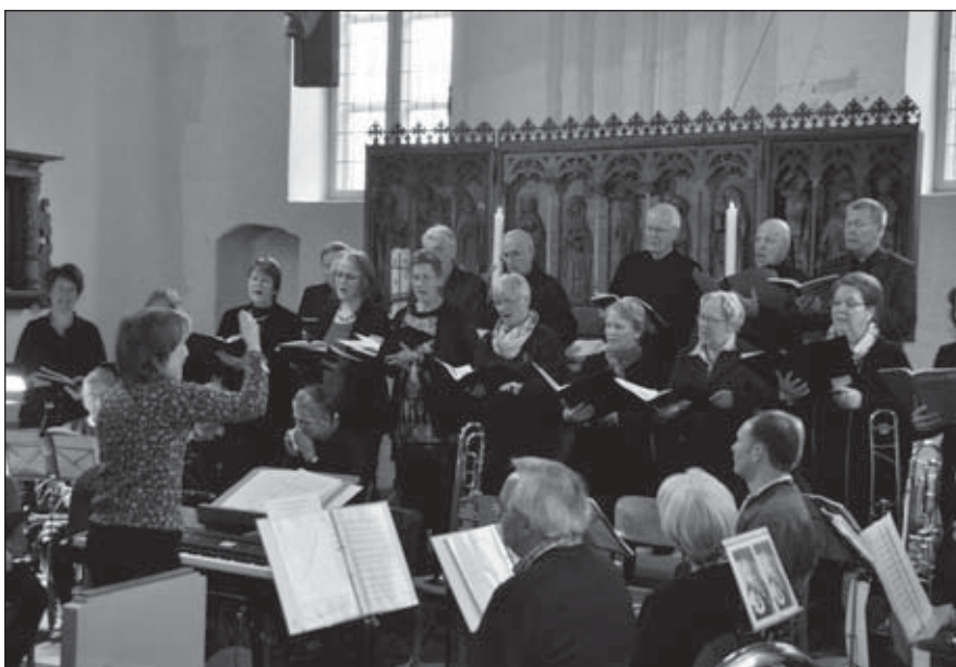
Die gemeinsame Abendmusik des Kirchenchores und des Posaunenchores in der Passionszeit in der Ev.-Luth. Kirche Flintbek begeisterte viele Zuhörerinnen und Zuhörer.