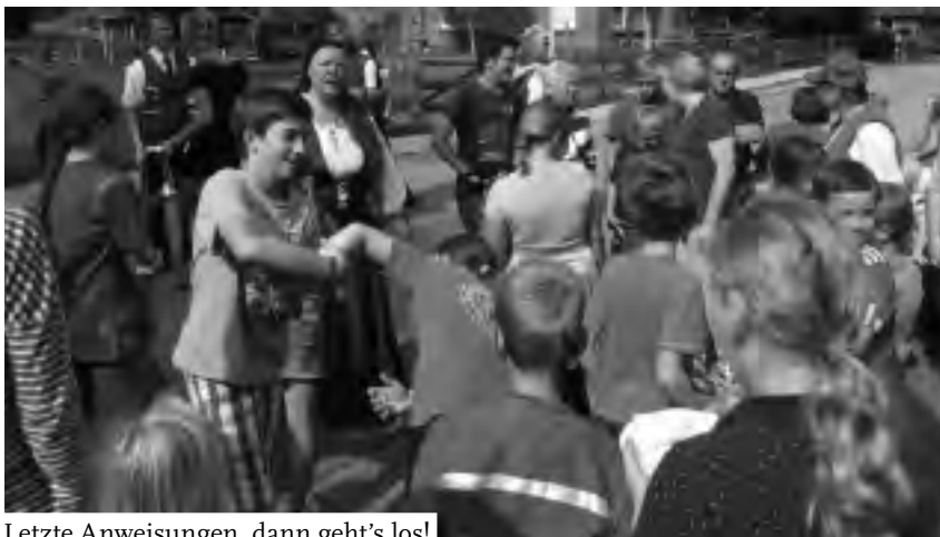
Letzte Anweisungen, dann geht's los!

Ohne die vielen Helferinnen und Helfer aus dem Dorf, die Infocettel verteilten, Geld und Sachspenden sammelten, die Spiele betreuten, Preise einkauften, für das leibliche Wohl – auch Dank vieler leckerer Kuchenspenden – sorgten, ist so ein Fest nicht möglich. Ein besonderer Dank gilt der Feuer-