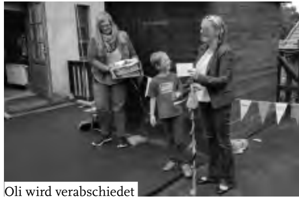
Oli wird verabschiedet

Besuchen Sie auch unsere homepage: www.kleine-flintsteine.de