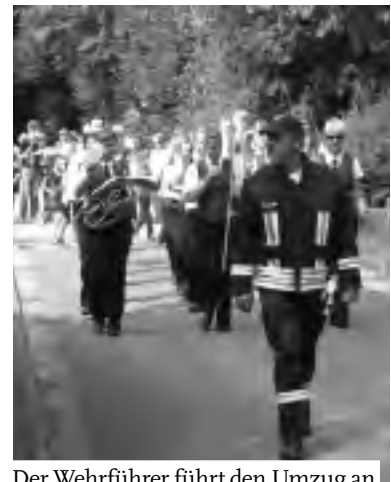
Der Wehrführer führt den Umzug an