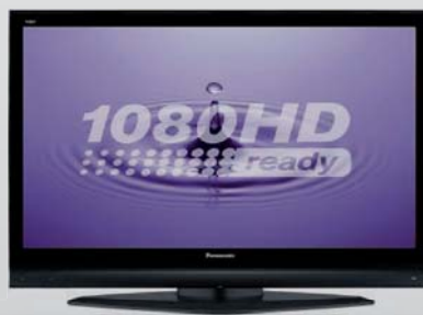
Panasonic Plasma ab 37"