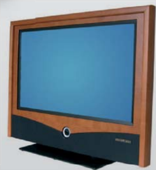
Screenart in Holzdesign mit Loewe-Technik

Adelheidstraße 26 (am Exer) 24103 Kiel ☎ 0431-95567