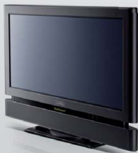
Metz Linus 32" oder 42"